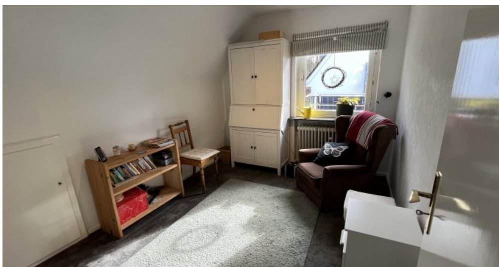
Das zweite der 3 Schlafzimmer