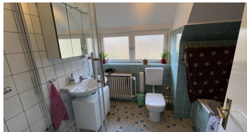
Bad mit Dusche und Wanne